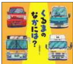
くるまのなかには? 石橋 真樹子 さく 福音館書店