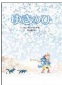
ゆきのひ サム・アッシャー 作・絵 吉上 恭太 訳 徳間書店